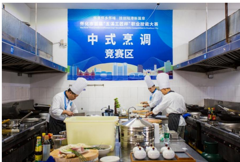
（“五溪工匠杯”中式烹调竞赛现场）

5. 深化服务功能，增强社会化服务创造力，充分发挥校企优势资源。成功举办了多期针对困难家庭子女的就业技能培训班、新型学徒制培训班、供销系统的“三社合一”培训班、农村电子商务技能培训班、怀化市财政支农政策的师资培训班以及创业培训班、农村劳动力转移技能培训班、退役军人再就业培训班、下乡送技培训班等。还多次成功主办了“班主任能力提升国家级培训班”、“怀化市班主任基本功能竞赛”、“健康中国怀化行”、“怀化市加工制造类职业技能大赛”、“味道湖南怀化味道”以及“武”等活动。“陵山片区烹饪技能大赛”以及怀化首届“*五溪工匠杯*”职业技能大赛等重要活动，以技工院校为核心，联合行业企业积极参与，为推动区域经济发展和乡村振兴做出贡献。