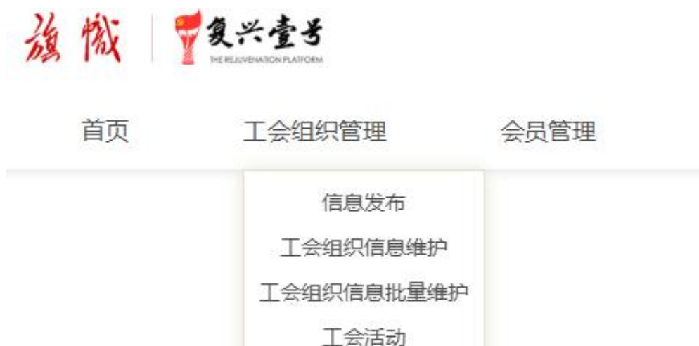
（“复兴壹号”工会管理平台）

学校工会进行数字化转型是适应时代发展需求、提升服务效能的重要举措。通过数字化转型，工会可以更好的履行维护职工权益、促进和谐劳动关系的职责，为职工提供更优、更便捷的服务。