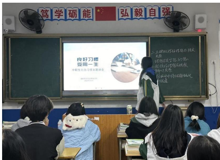
（“学生行为习惯养成教育”主题班会）