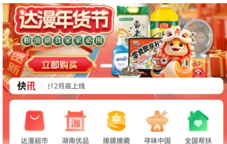
（“达漫电商”平台首页界面）