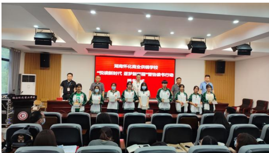
（学校开展丰富多样的红色主题教育活动）

为主导，扎实开展多种红色实践活动，努力把党史国史教育从课堂延伸到课外，从学校延伸到社会；二是积极打造“红色”教育平台，浓厚文化氛围，利用办公楼、教学楼文化墙打造“党史国史红色教育长廊”，利用学校网络班班通资源定期对师生进行党史国史红色宣传教育；三是传承楚怡职教精神，引导职教学生树立“立身以学为先，立学以读书为本”的学习理念，养成“爱读书、读好书、善读书”的习惯，激励职教学生砥砺奋进、追梦前行，举办了“楚怡读书书香校园”行动授书仪式。