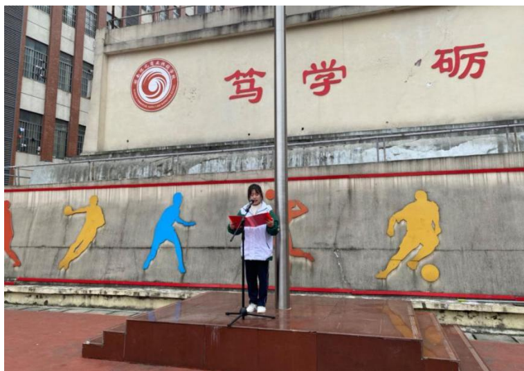
（“学生行为习惯养成教育”国旗下的讲话）